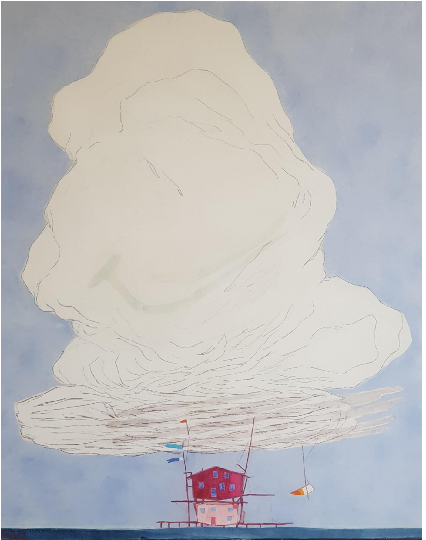
Maison perchée rose et nuages, 2022, gouache et cire sur papier marouffé sur toile, 100 x 81 cm