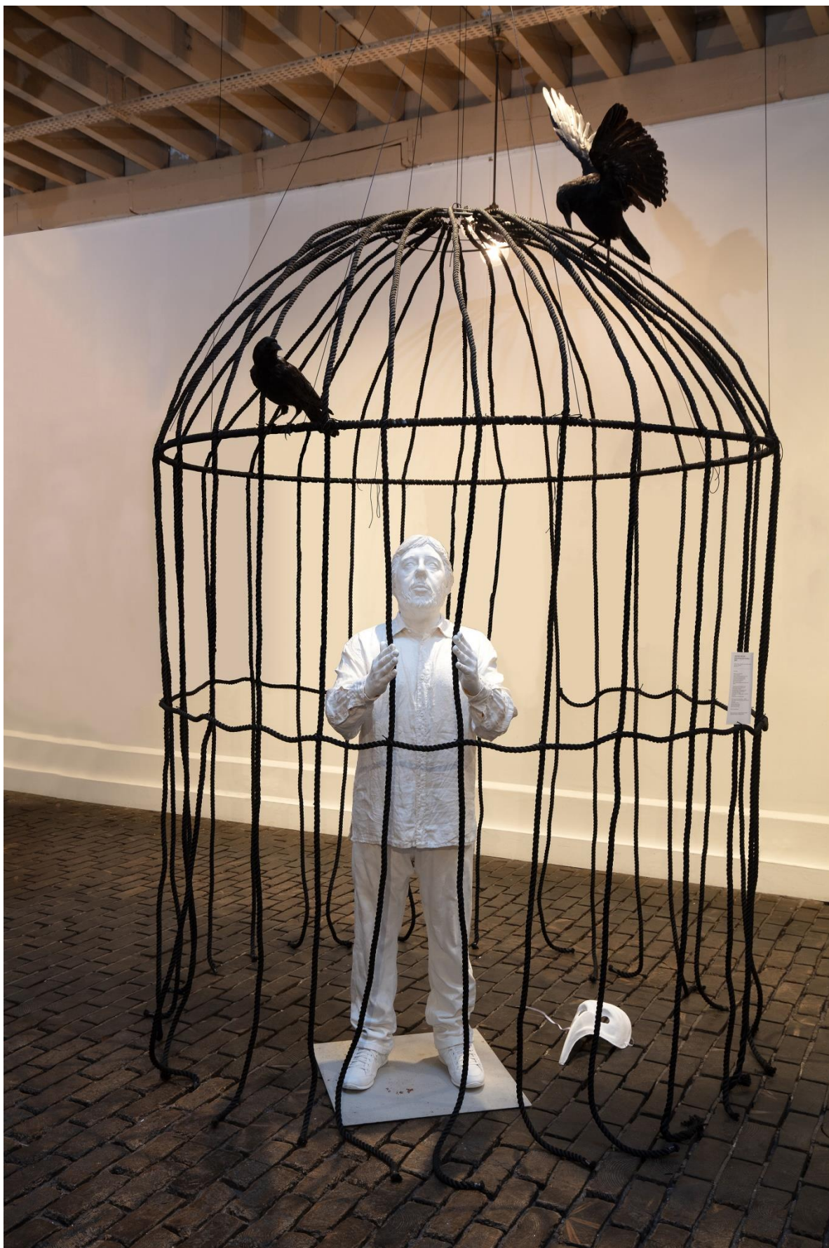
Self Portrait – Mes corbeaux, 2020, installation : résine, textile, acrylique, corde synthétique, corbeaux empaillés, 280 x 180 x 180 cm