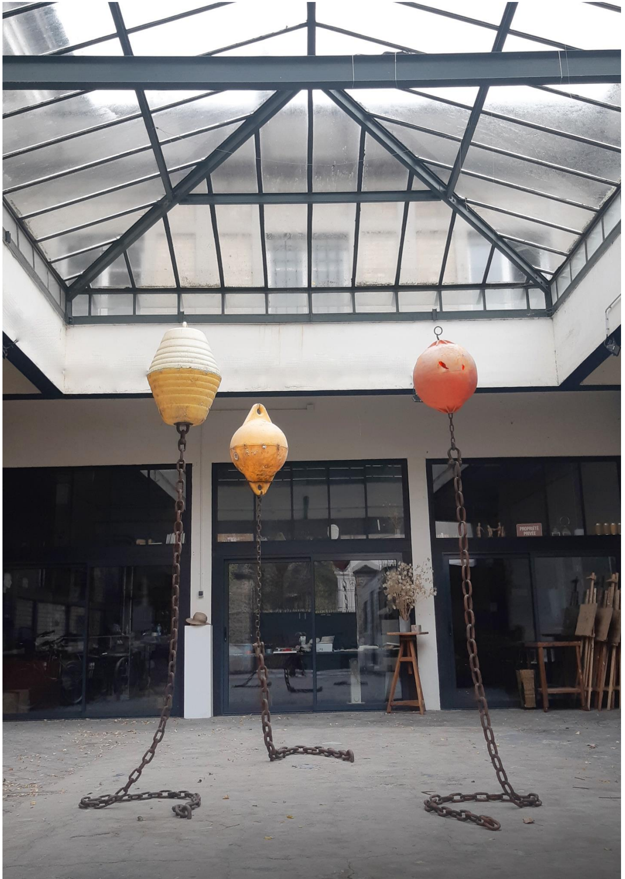
Face à la mer, n° 6 & 7 (2019) et 16 (2023), bouées marines et chaînes métalliques de rebut, environ 275 x 70 x 60 cm