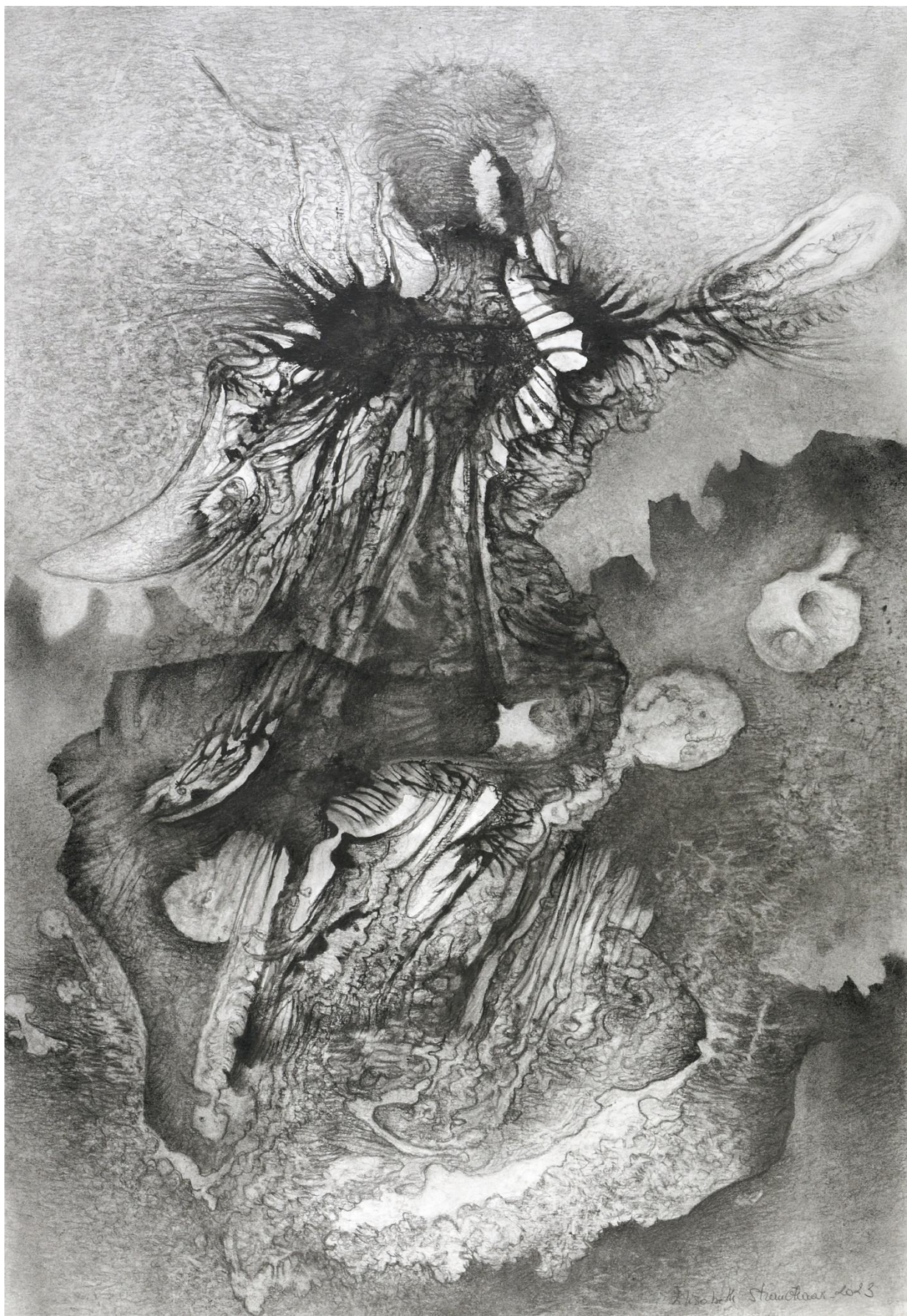
A2-2-2023, 2023, crayon graphite, poudre de graphite, pâte de graphite, 59,4 x 42 cm