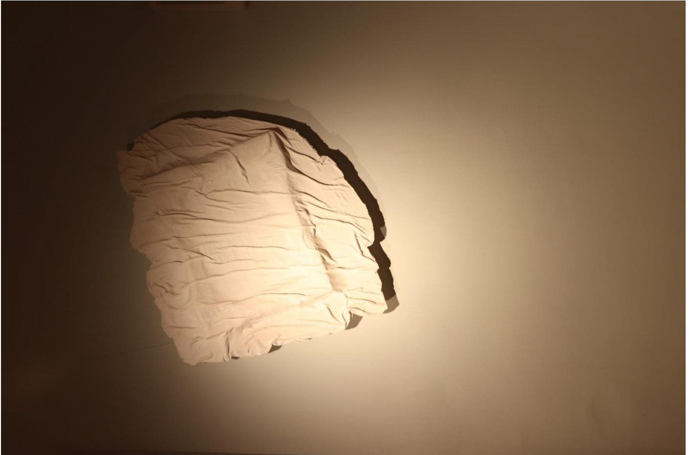
Emporté par la houle, 2023, tissu et plâtre, 60 x 50 x 10 cm