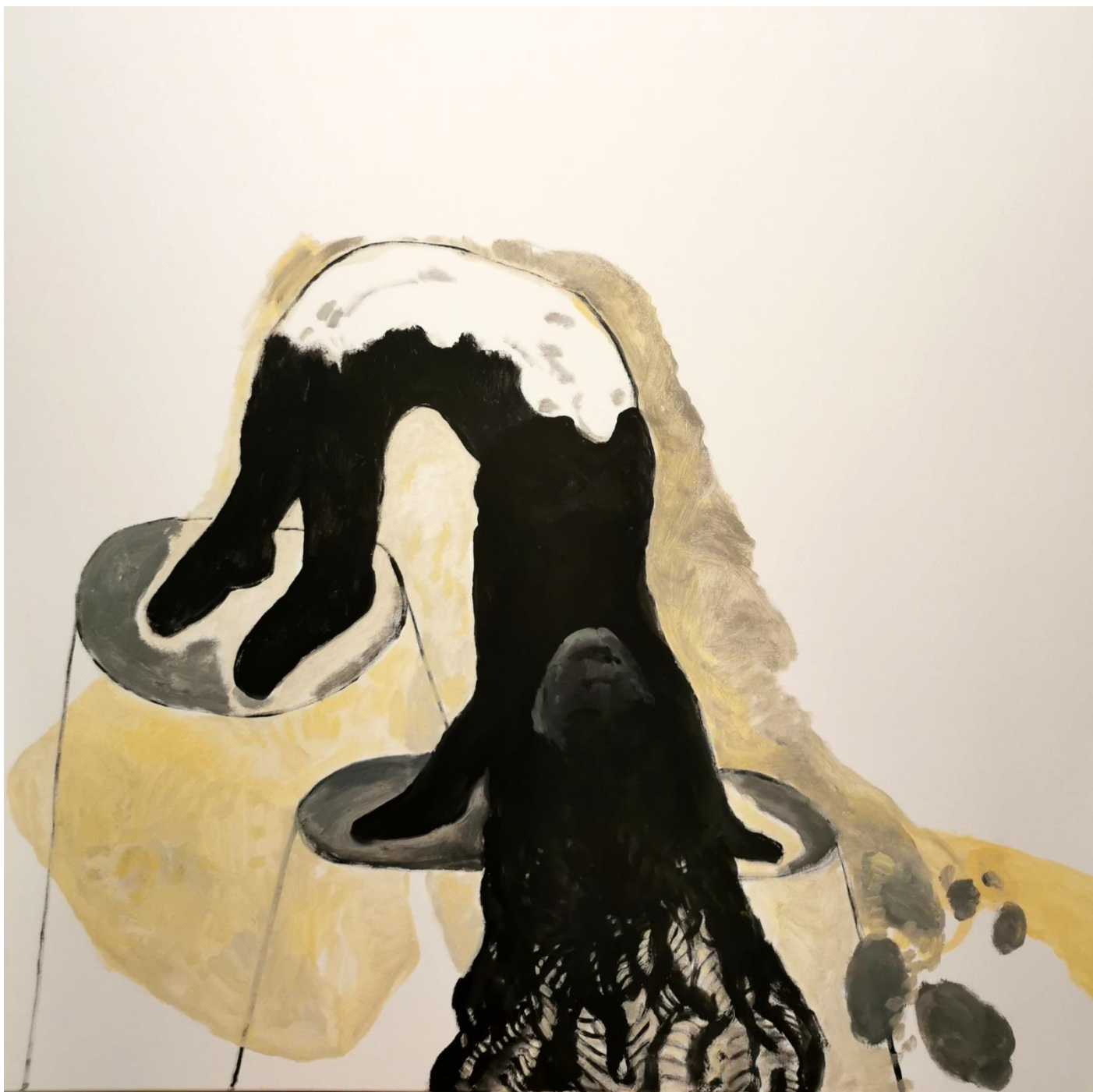
Terremoto, autoportrait au séisme, 2023 peinture acrylique sur toile, 120 x 120 cm