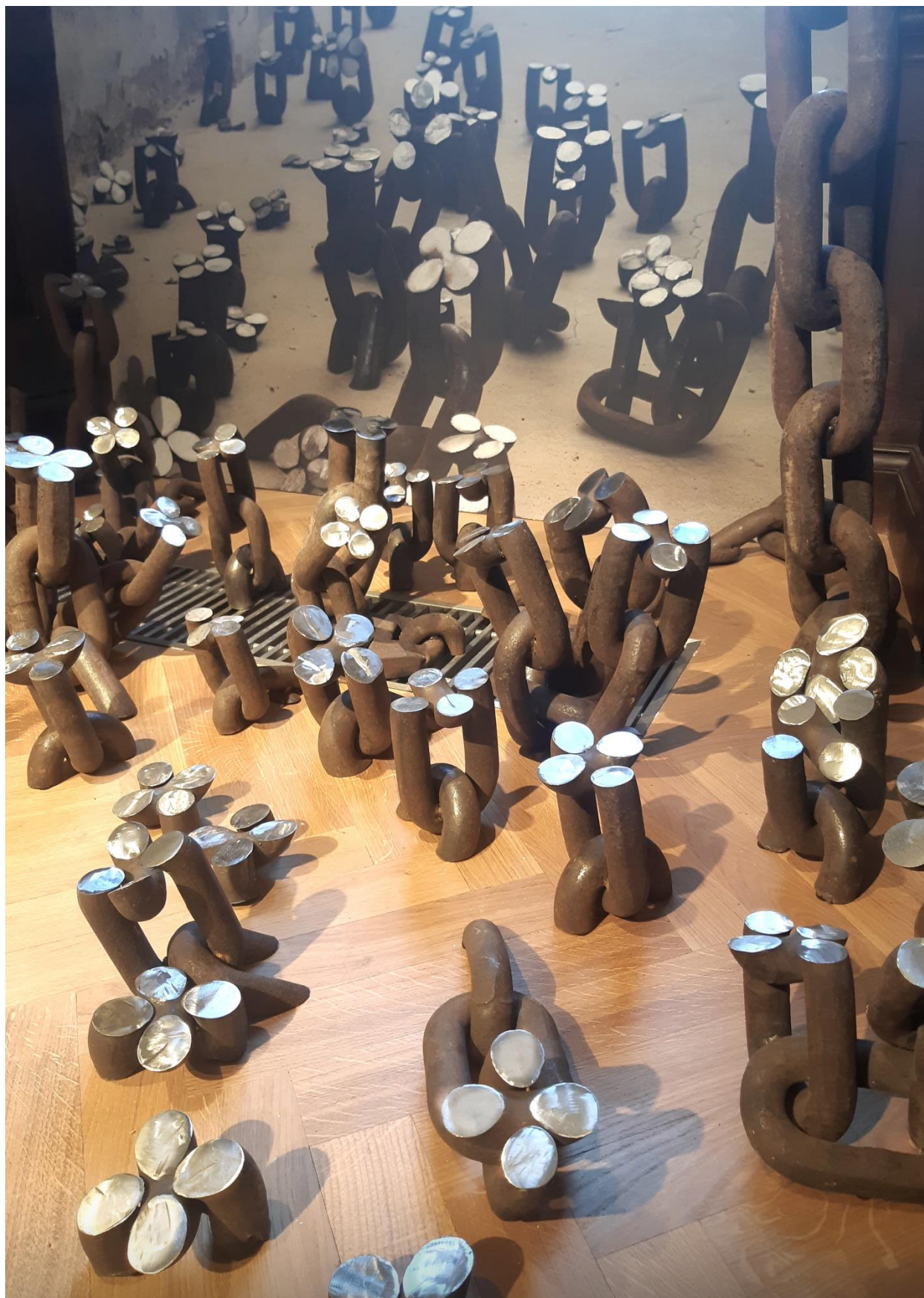
Fleurs de Terezín, 2022, maillons de chaînes métalliques de rebut, coupés, soudés et polis et, en arrière-plan, photo de l'installation dans le camp de Terezín, Tchéquie, dimensions variables