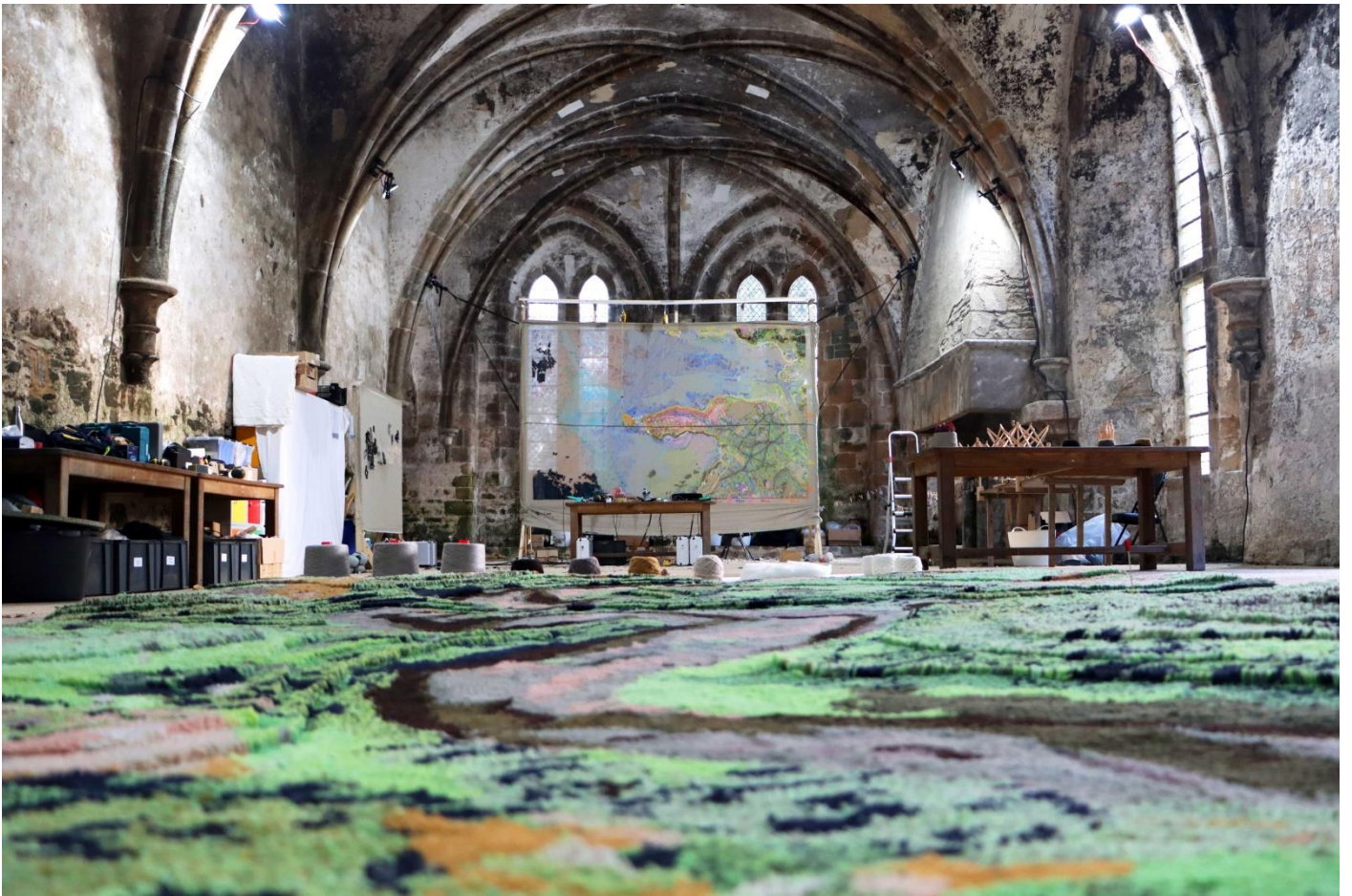
Atelier participatif Pays'Âges , 2023, Abbaye de Beauport, Paimpol, et présentation de la tapisserie-témoignage du Fleuve Laita, au premier plan